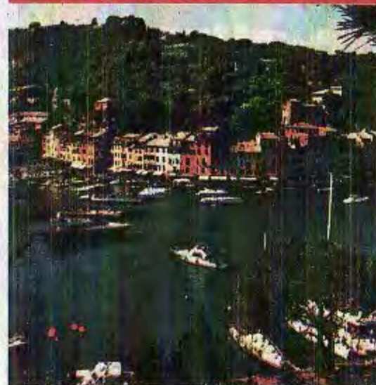
Voor echte chichi ga je naar de jachthaven.