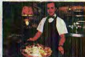
Da O Vittorio serveert heerlijke foccacia col formaggio.

Vittorio en Gianni aan het roer. Je kan er ook overnachten in de albergo met 20 kamers, vanaf 75 euro per kamer per nacht met ontbijt. In Camogli zelf moet je naar restaurant Rosa. www.daovittorio.it www.rosaristorante.it