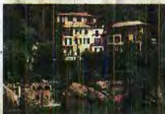
Romantisch logeren kan in Domina Home Piccolo.

mer per nacht met ontbijt. De meest authentieke wijnbar, met vrouwelijke sommelier, van Portofino is Winterose aan het eind van de kade. Bestel er een sublieme Rossese di Albenga uit een kristallen glas, met een beetje ham, worst of kaas. www.dominavacanze.it